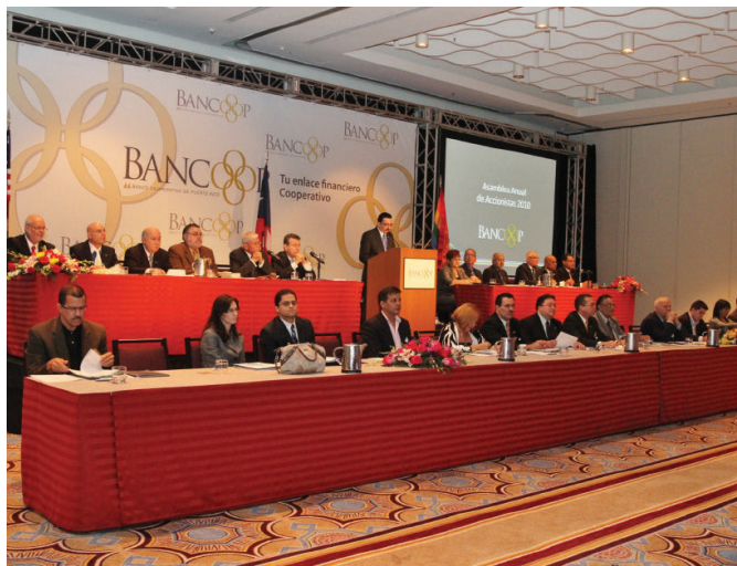
Bajo el tema: “Enlace para el crecimiento de Puerto Rico” se llevó a cabo la Asamblea Anual del Banco Cooperativo el pasado 21 de mayo en el Hotel Sheraton de San Juan.

Durante la Asamblea Anual, BanCoop renovó su compromiso con el modelo financiero cooperativo. El énfasis de este sistema en la economía social y los servicios lo han convertido en una solución sólida y confiable para toda la población, sobre todo en momentos de grandes desafíos económicos. ■