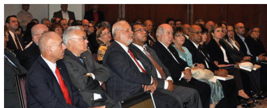
Representantes de las Cooperativas Afiliadas se dieron cita en la actividad celebrada durante el mes de abril en el Hotel Sheraton.