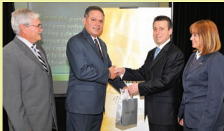
Durante la actividad de aniversario se hizo entrega a los empleados de un obsequio conmemorativo.

BanCoop comenzó operaciones con un capital de $1,000,000 en 1974. Desde entonces, ha sido fiel a su misión de promover el bienestar general de las Cooperativas de Ahorro y Crédito, proveyéndoles servicios dirigidos a satisfacer sus necesidades y las de sus socios. Esto se ha logrado mediante la canalización efectiva de los recursos del Movimiento Cooperativo y ha contribuido al desarrollo socioeconómico de Puerto Rico.