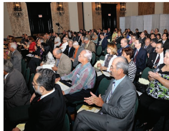
Los delegados asistentes a la Asamblea Anual 2009 prestan atención a los informes.

Como parte de los trabajos, quedó en funciones la misma Junta de Directores, debido a que fueron reelectos los miembros cuyo término vencía. Además, las Cooperativas socias presentaron sus obsequios a la empresa con motivo de la celebración del 35 Aniversario.